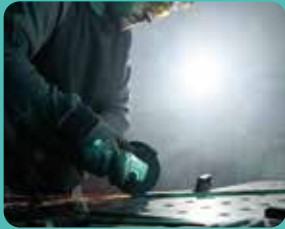
SCANGRIP FOR LIFE